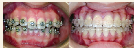
マルチブラケット装置(ワイヤー)

後半のステージでは、 歯の位置を理想的なポジションに並べていきます 。 歯はスペースさえあれば、簡単に移動して理想的な位置に並べることができます。この時に使う装置は、皆さんがよく矯正と言われてイメージするマルチブラケット装置(ワイヤー)が一番スピーディです。