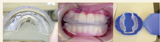
マウスピース矯正

あごが小さいというお子さん、乳歯の時にキレイに歯が並んで隙間がなかったお子さん、お父さんやお母さん自身が受け口や歯列不正(遺伝しやすい)というお子さんは、矯正治療が必要な場合がよくあります。ご相談ください。